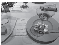
地産地消を目指す本格的なイタリア料理 オイシカッタデス!