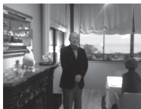
河合会長のご挨拶