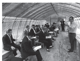
「パソナ農援隊」の会社説明を受ける