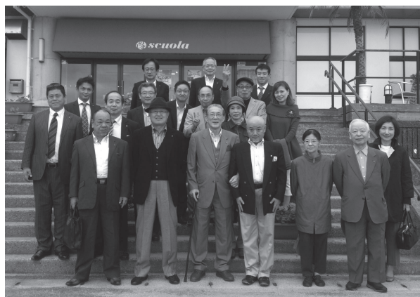
旧小学校をリフォームした「のじまスコラ」