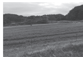
「チャレンジファーム」