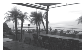
「のじまスコラ」から 播磨灘を望む