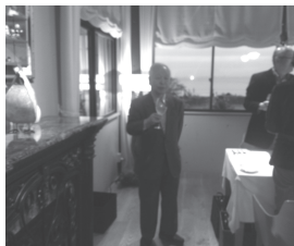
平野会員による乾杯