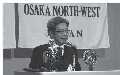
小嶋会長エレクト 中締め