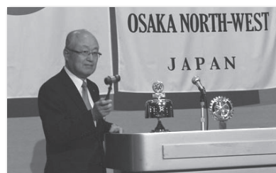
河合会長 年頭のご挨拶