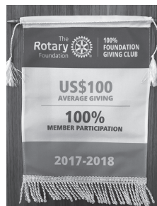
100%ロータリー財団寄付クラブ