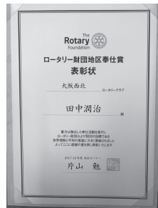
ロータリー財団地区奉仕賞

本日計 80,000円 / 総合計 714,000円 (目標 1,300,000円) ご協力ありがとうございました。