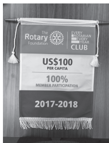
Every Rotarian, Every Year