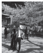
桜の下で (竹井会員と尾下会長)