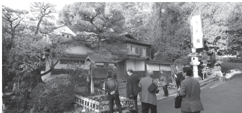
円山公園内の料亭「左阿彌」さん