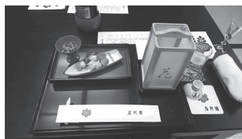
素晴らしい京懐石料理でした！