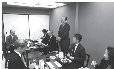
平林会員による乾杯